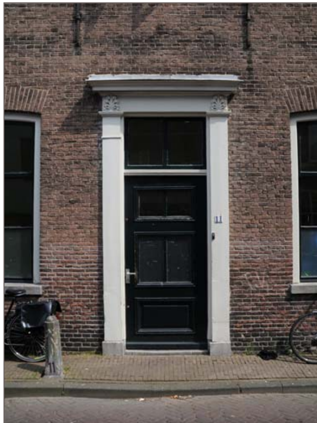
Afbeelding 1 - Entree