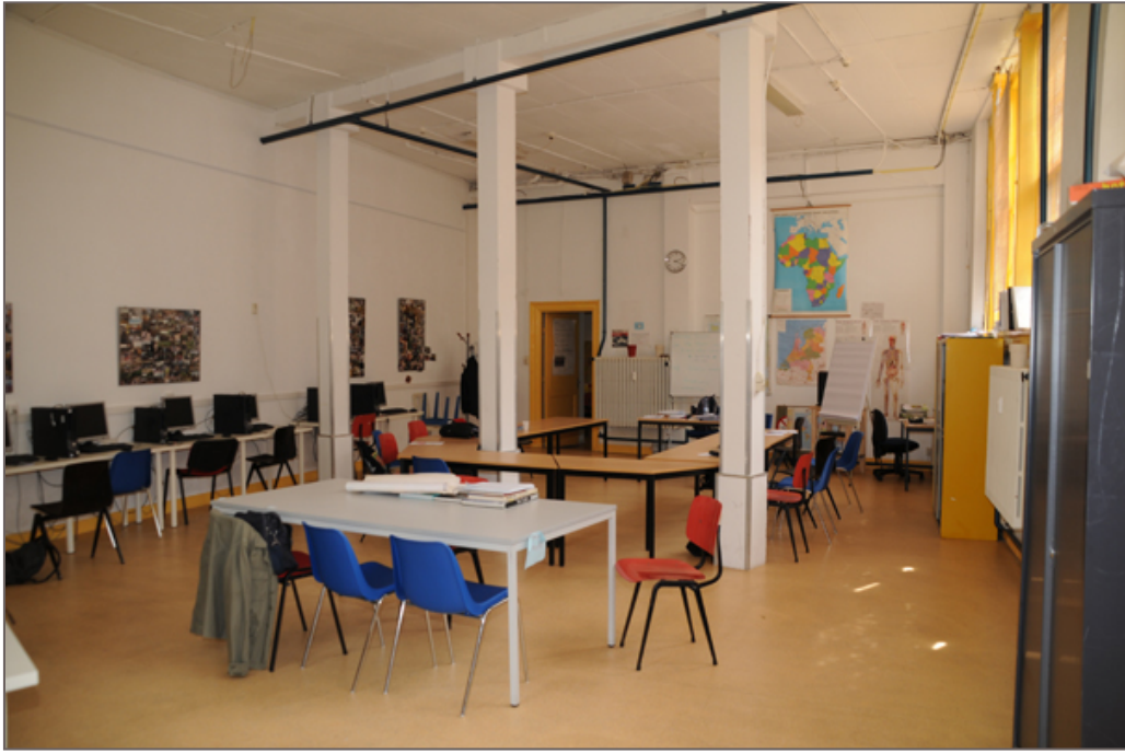
Afbeelding 4 - Ruimte D101