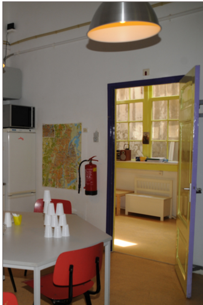
Afbeelding 5 - Ruimte D102