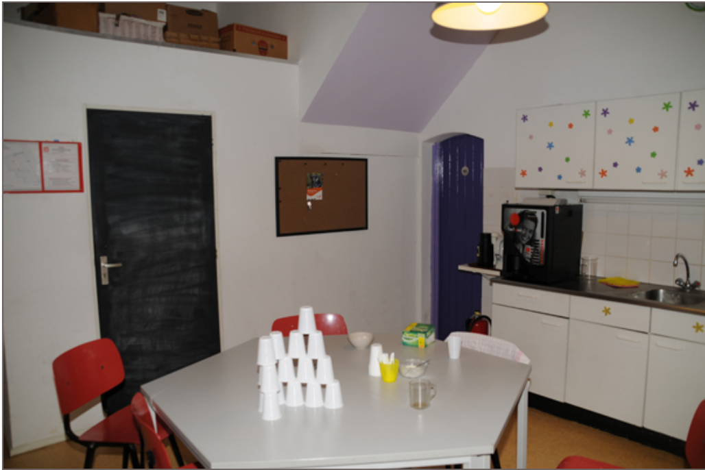
Afbeelding 6 - Ruimte D102