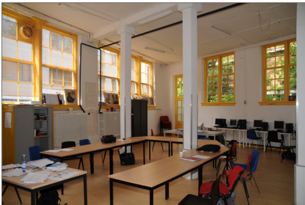
Afbeelding 3 - Ruimte D101