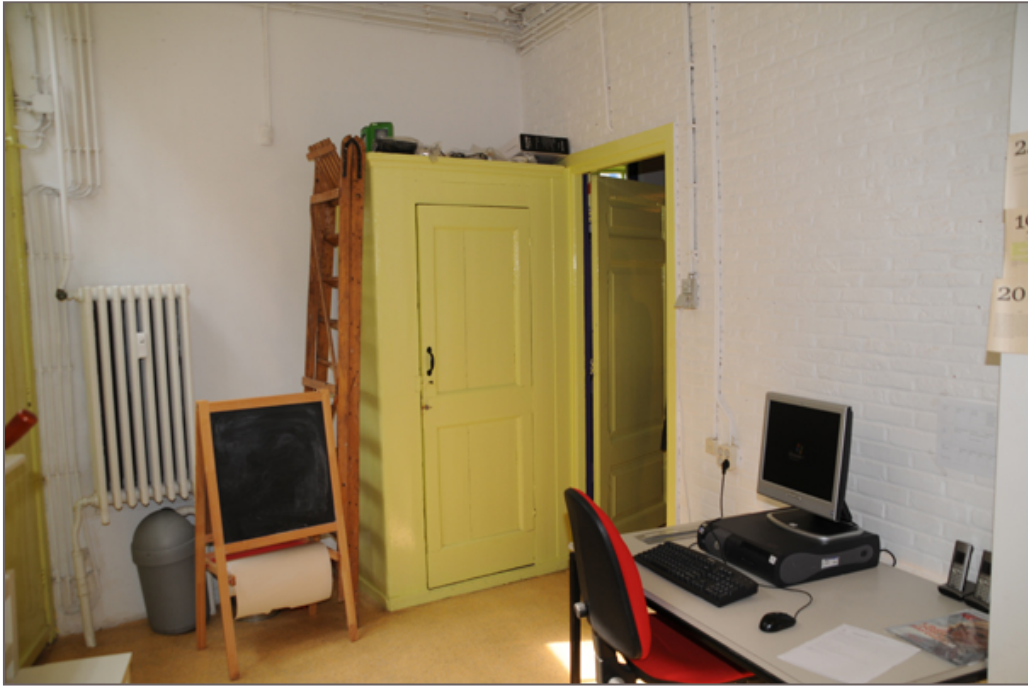
Afbeelding 8 - Ruimte D103