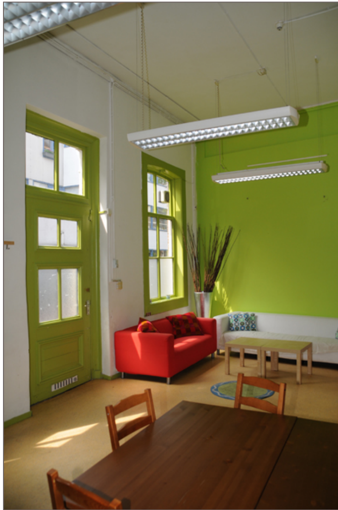
Afbeelding 2 - Ruimte D106