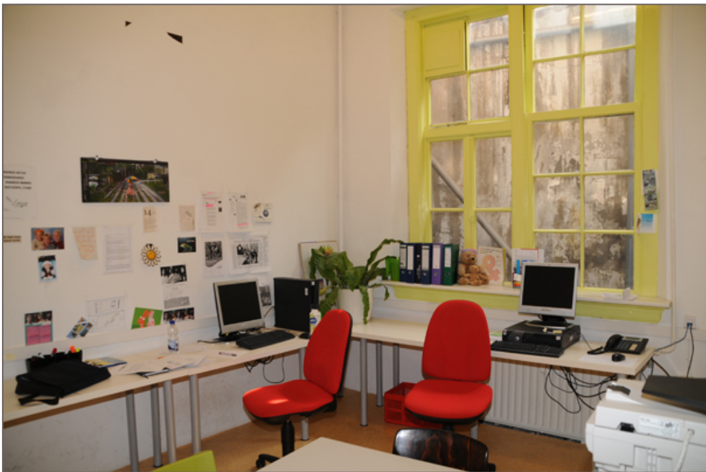
Afbeelding 7 - Ruimte D104